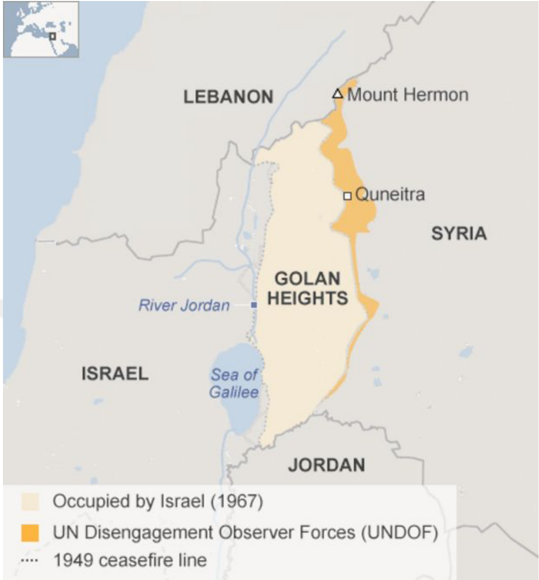
Harita 3.1. 1973 Savaşı Sonrası Golan Tepeleri Haritası

‘Yeni’ kavramı Ortadoğu için bu tezde birkaç defa kullanılacaktır; çünkü bu bölgenin siyasi tarihi önemli kırılmalar yaşamış, her kırılma sonrası öncekine nazaran ‘yeni’ bir düzen getirmiştir. 1967-1973 yılları arasında da tarafların daha çok askeri jeopolitik unsurları kullandığı ve onlara önem verdiği görülmüştür. Fakat 1973’ten sonra oluşan düzende genel olarak Arap Devletleri ve İsrail arasındaki ilişkilerin, özel olarak da Suriye ve İsrail